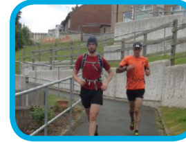
Prestatyn Running Club Running Everest