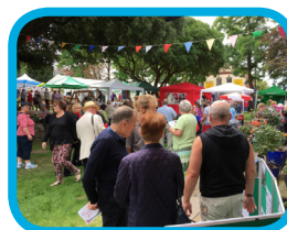
Sioe Flodau Prestatyn