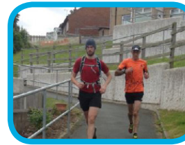
Clwb Rhedeg Prestatyn 'Festive Prestatyn' rhedeg Everest