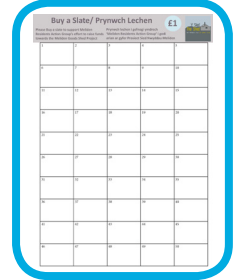
Buy a Slate

An Events and Fundraising Committee was formed after the open day in January 2016 and the group meet every other month to discuss, arrange and organise fundraising events in the community to raise money for the project. It is great that members of the community are working together to fundraise, and we hope to reach our target over the next 18 months. To date £1546 has been raised but after the fantastic news from the Lottery the group have gathered momentum!! Above are some of the ways the group have been fundraising so far.