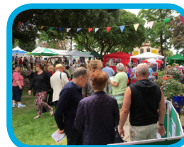
Prestatyn Flower Show